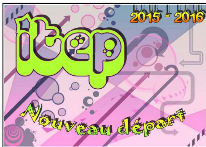
Maquette de la fresque réalisée par les enfants de l'itep Jean Fayard

Coordonnées pour nous communiquer votre réponse et le nombre de personnes présentes :